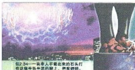
但2:34“一块非人手磨出来的石头打在这像半铁半泥的脚上，把脚砸碎。”

先知但以理看到当人们正设法联合欧洲的国家并且世界上灾难和战争日益增多时，一块巨石将打在佛的脚上并完全摧毁它。这石头代表耶稣基督的来临(但2:34-35，44，诗18:31)。基督将像众天使的天使们在天云中再来，是全人类所看得见的(启1:7)。为了预备人类面临这一事件，并帮助他们在审判中站立，上帝用祂慈爱的爱，正在发出最后恩典的信息警告人类。这信息在启示录14:6-12中可以发现。