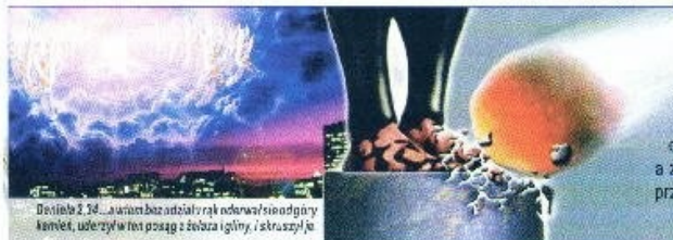
Do siebie 2, 14. „...a teraz bez odwołania i odwołania kamień, uderzy w nogi posag z żelaza i gliny, i skruszy je”

Prorok Daniel widzi czas w którym ludzie próbują zjednać narody Europy, widzi też świat pełen katastrof wojen, i jak wielki kamień uderza w nogi posagu rozbijając go. Ten kamień symbolizuje przychodzącego Chrystusa (Dan.2,34-35; 44), którego już niedługo zobaczymy nadchodzącego w obłokach wraz z orszakiem aniołów (Obj.1,7). Aby udzi na te wydarzenia przygotować, a zarazem pomóc przetrwać czasy sądu, Bóg ostrzega nas w swej nieskończonej miłości, przez trzy ostatnie poselstwa dla świata, które znajdujemy w 14 rozdziale Objawienia.