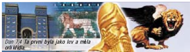
Dan 7,4 Ta první byla jako lev a měla orlí křídla.

Zlatá hlava a lev (oblíbený symbol Babylónu) představují Babylónskou říši (608-538 př.n.l.). Orlí křídla znamenají rychlé dobovačné války za vlády Nabuchodonozora.