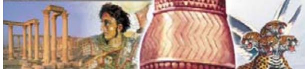
Dan 7,6 Další šelma byla podobna pardovi a měla čtyři plácí křídla a čtyři hlavy.

Nesmírně rychle dobovačné výpravy (viz. 4 křídla) za Alexandra Velikého přinesly Řecku světovou nadvládu (331 př.n.l.). Po Alexandrově smrti byla říše rozdělena jeho čtyřmi generály na čtyři části: Thracie, Sýrie, Makedonie a Egypt (viz. 4 hlavy).