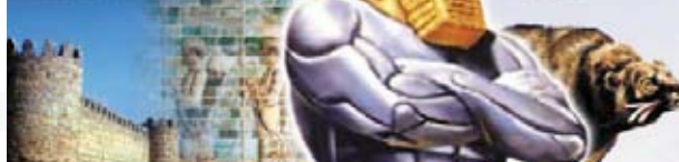
Dan 7,5 Ta druhá se podobala medvědu která panství jedno vyzdvihla. Mělav tlamě tři zebra.

V roce 538 př.n.l. byla vybudována dvojitá říše, Médská a Perská. Tři zebra znamenají dobyté země: Lydiu, Babylón a Egypt. Peršané byli mocnější než Médové a vládli také déle (viz. na jednu stranu postavený medvěd – vyzdvíženo panství).