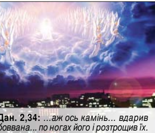
Дан. 2,34: ...аж ось камінь... вдарив боввана... по ногах його і розтрощив їх.