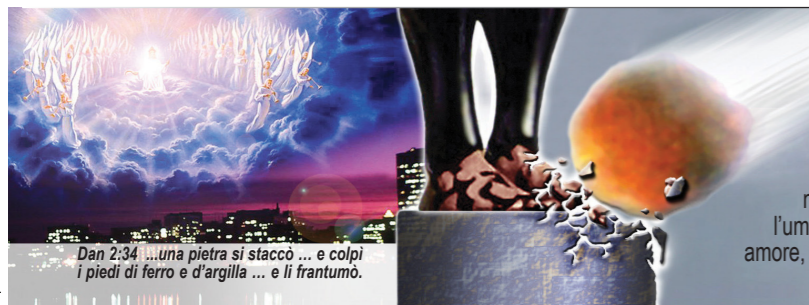
Dan 2:34 "...una pietra si staccò... e colpì i piedi di ferro e d'argilla... e li frantumò."