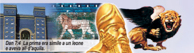
Dan 7:4 La prima era simile a un leone e aveva ali d'aquila.

A causa delle emigrazioni in massa (351 - 476 d. C.) l'impero Romano si divise in 10 regni europei più piccoli (Notate le 10 corna e le 10 dita dei piedi). I prosperosi corni separati e la non possibilità di fondersi insieme come la mescolanza del ferro con l'argilla delle 10 dita dei piedi rappresenta l'impossibile durata dell'Europa Unita.