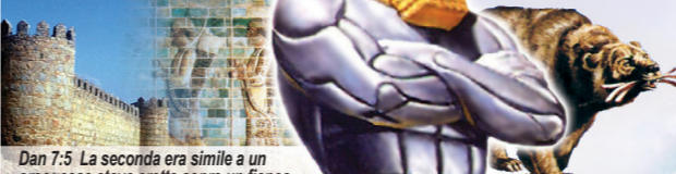
Dan 7:5 La seconda era simile a un orso; essa stava eretta sopra un fianco. Essa teneva tre costole in bocca fra i denti.