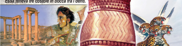
Dan 7:6 Un'altra era come un leopardo, essa aveva quattro ali d'uccello sul dorso e quattro teste.